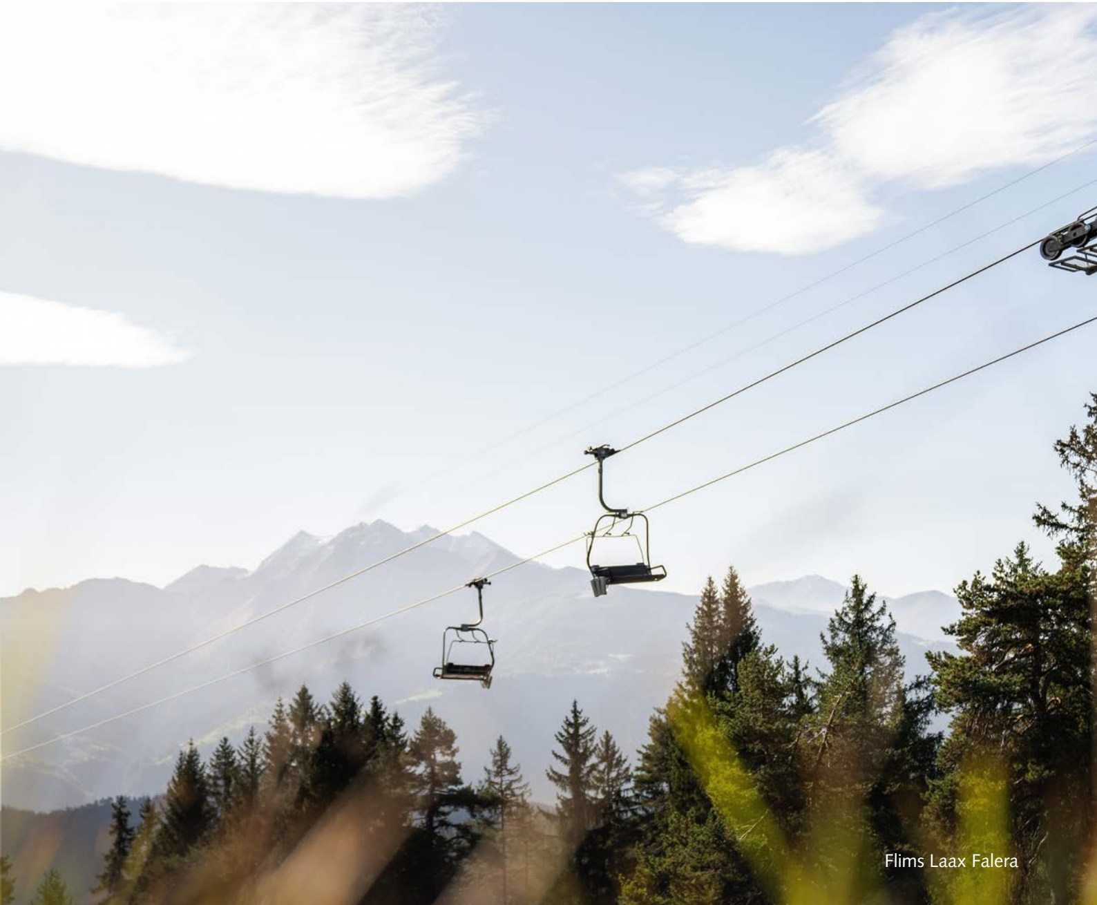
Flims Laax Falera

Whether it's the Rhine gouging out knife-edge ravines near Flims, the Alpine grandeur of the Swiss National Park, or the myriad of shimmering lakes, this wonderfully remote region encourages outdoor escapades.