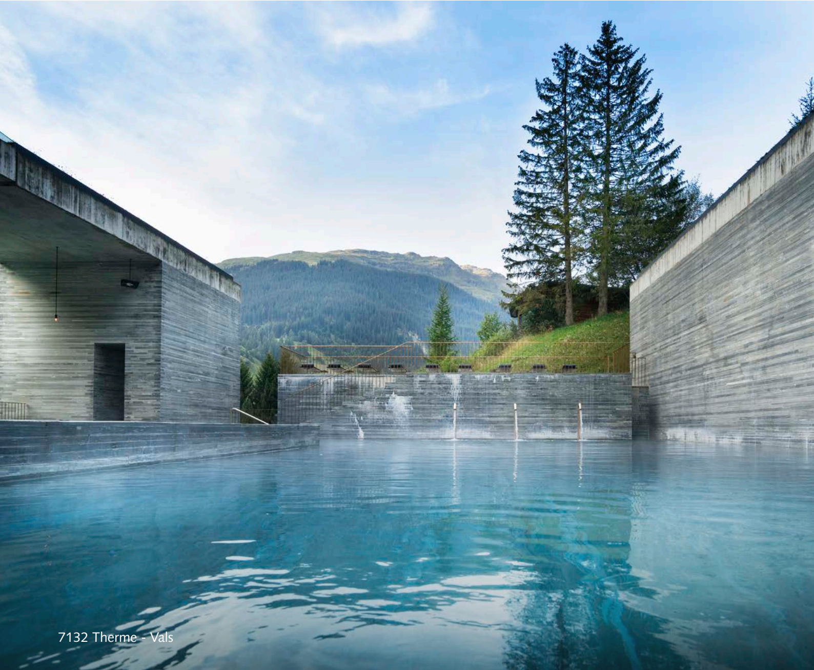
7132 Therme - Vals

Aristocracy, authors, poets, and the like have been making pilgrimages to the spa towns of Graubunden since the mid-1300s. From thermal bathhouses to leading health resorts, there's something for every type of wellness traveler to enjoy.