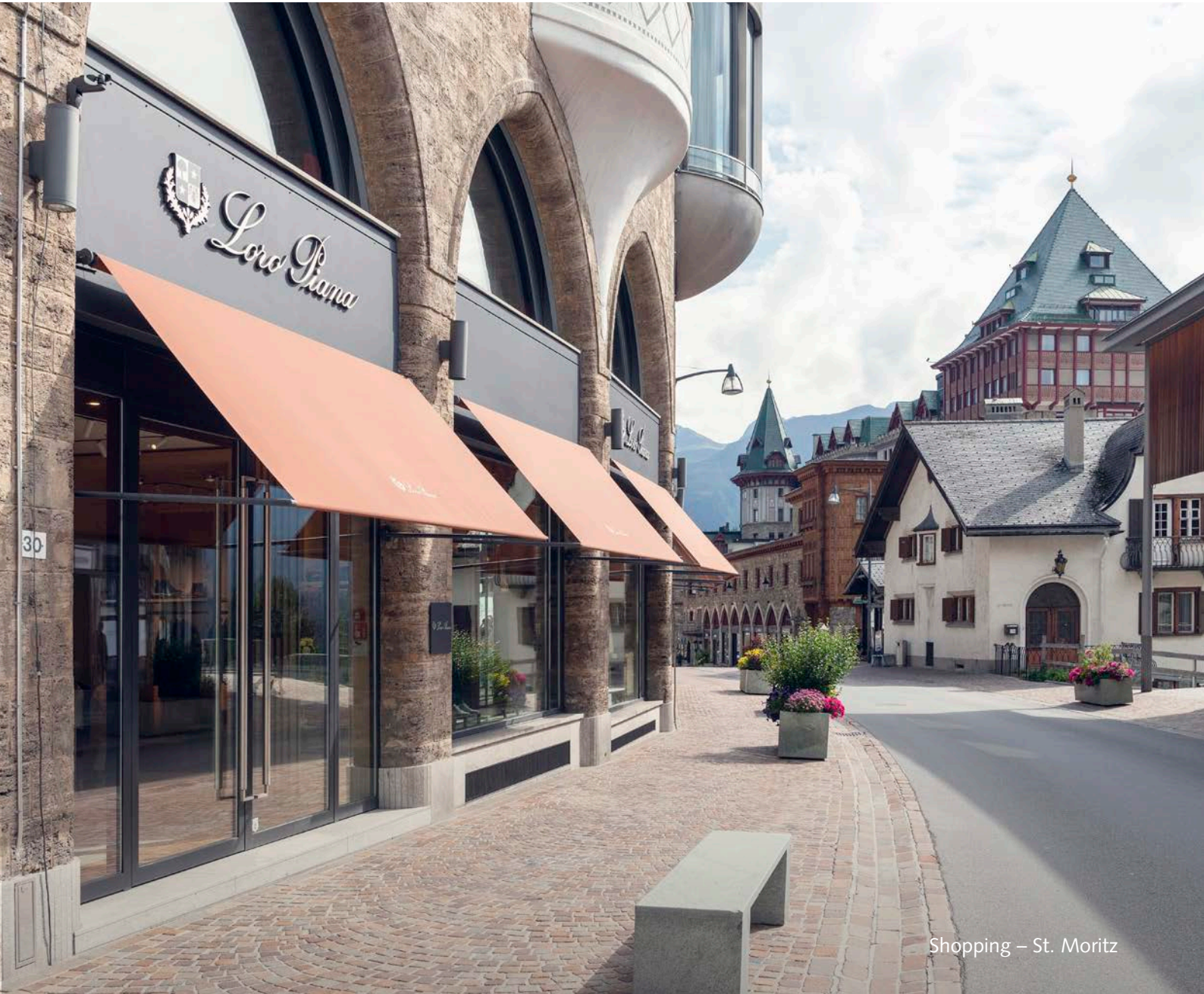
Shopping – St. Moritz

Graubunden's shopping scene is diverse and vibrant, spanning the spectrum from tax-free resorts to the haute couture of Via Serlas, St. Moritz.