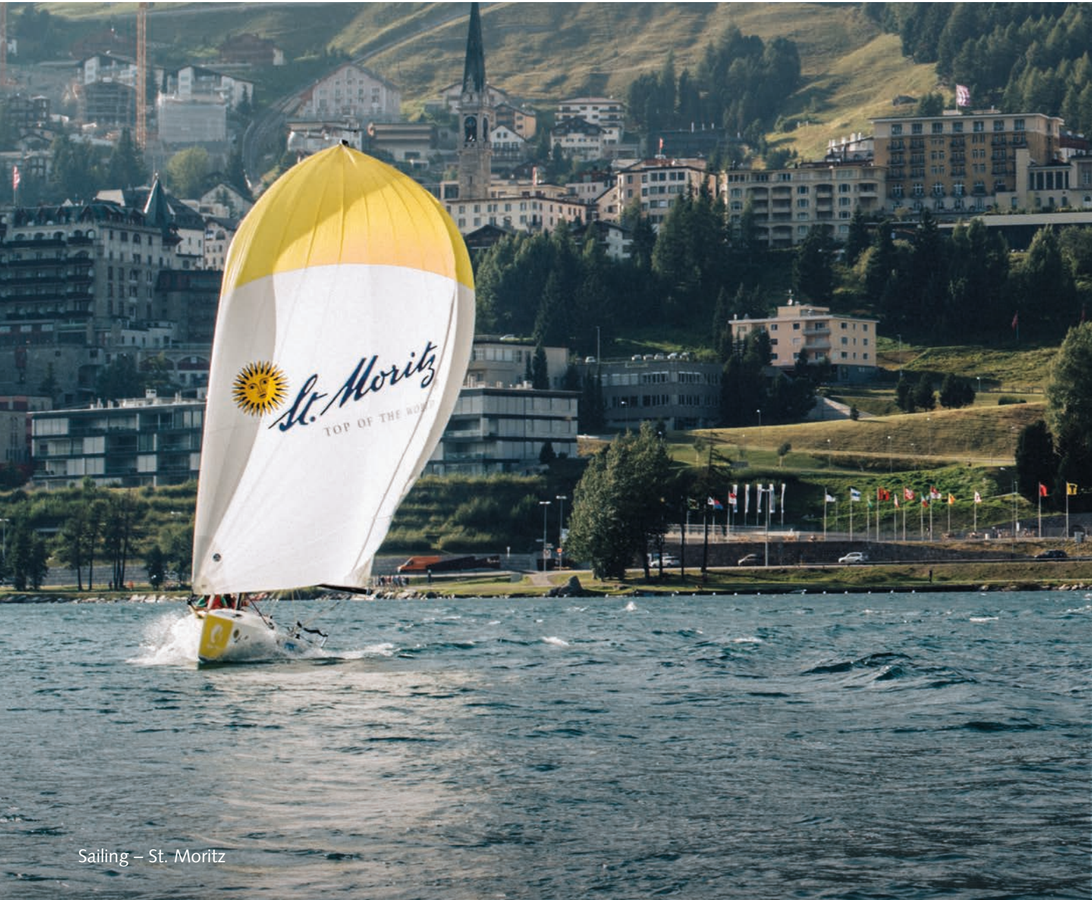
Sailing – St. Moritz

Wild and dramatic nature sets the scene for monster ski runs, downhill flow trails, and Europe's freestyle capital.