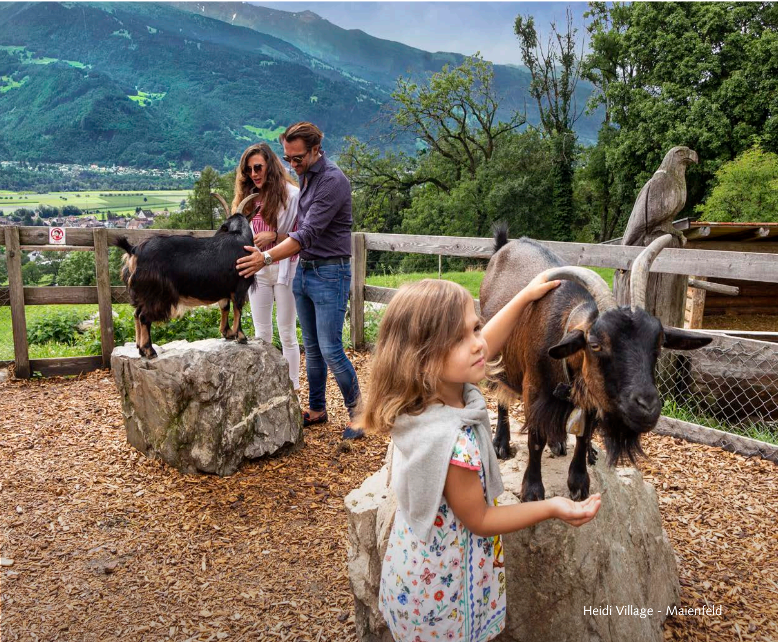
Heidi Village - Maienfeld

Safe, beautiful and easy to traverse, Graubünden is a dream for family travel. Kids will revel in rushing down Switzerland's longest toboggan run, reliving childhood memories in Heidiland, or making friends with Globi, Switzerland's Mickey Mouse.