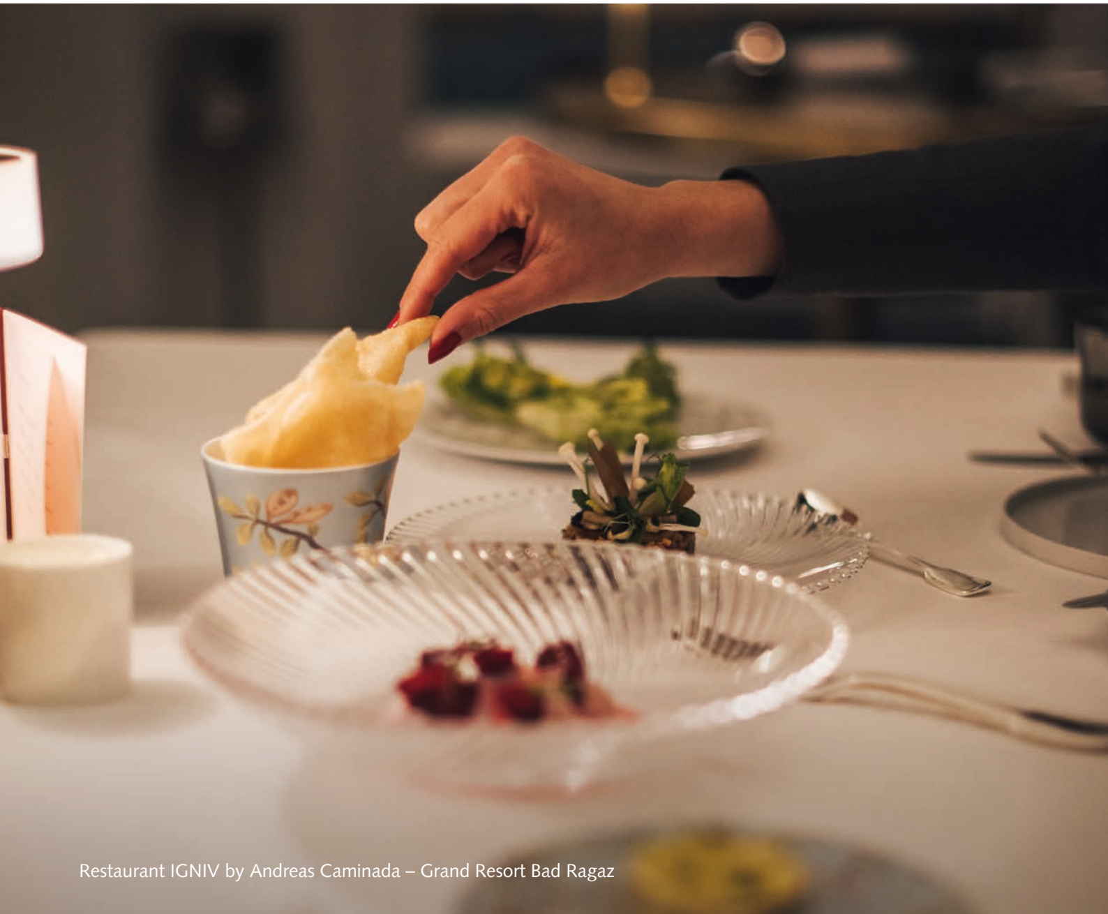
Restaurant IGNIV by Andreas Caminada – Grand Resort Bad Ragaz

Swiss-German, Italian, and Romansh influences ensure that Graubünden's culinary scene is a delicious ensemble of local specialties enhanced by starred performances of Michelin chefs.