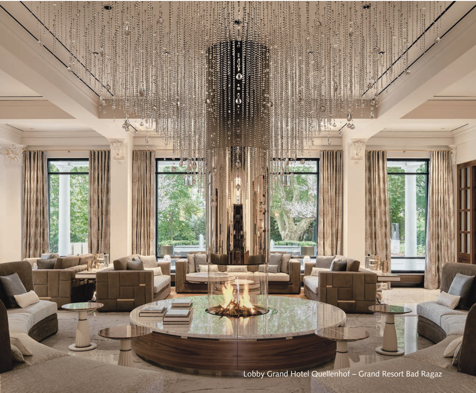
Lobby Grand Hotel Quellenhof – Grand Resort Bad Ragaz

Renowned for its world-class health spas, elegant resorts, Michelin-starred restaurants and famed shopping boulevards, life is beautiful in Graubünden.